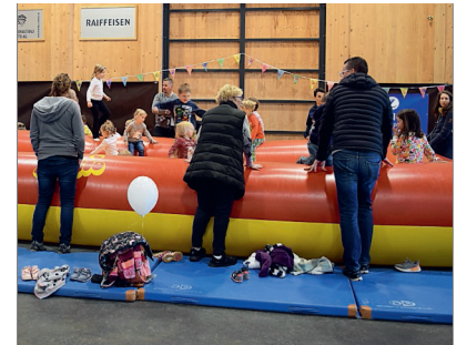
Die grosse Gumpimatte lud zum Springen und Toben ein.